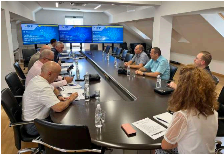
Slika 3.2: Sjednica Vijeća IPP FBiH