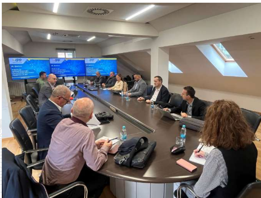
Slika 3.3: Sjednica Vijeća IPP FBiH