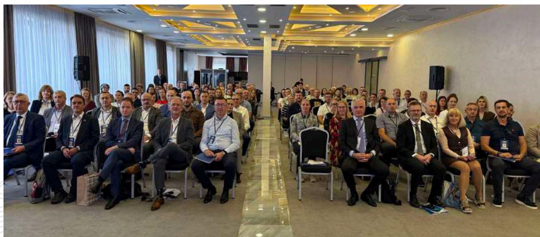
Slika 4.7: Konferencija „Dani IPP-a“ u Mostaru

Zaključeno je da su na predmetnom polju u prethodnom razdoblju napravljeni značajni iskoraci kroz aktivnosti Federalne uprave za geodetske i imovinsko-pravne poslove i tijela IPP FBiH, Vijeća IPP FBiH i radnih skupina.