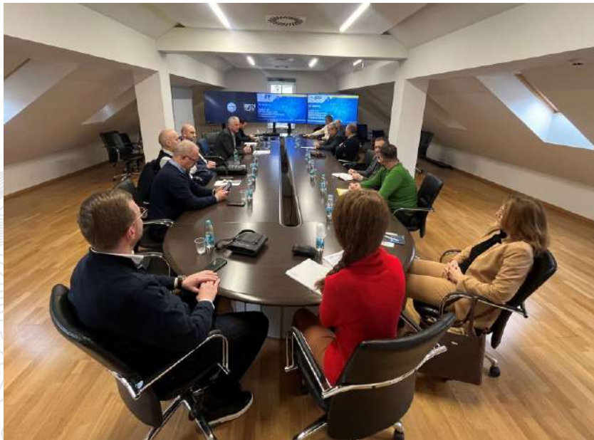
Slika 3.1: Sjednica Vijeća IPP FBiH