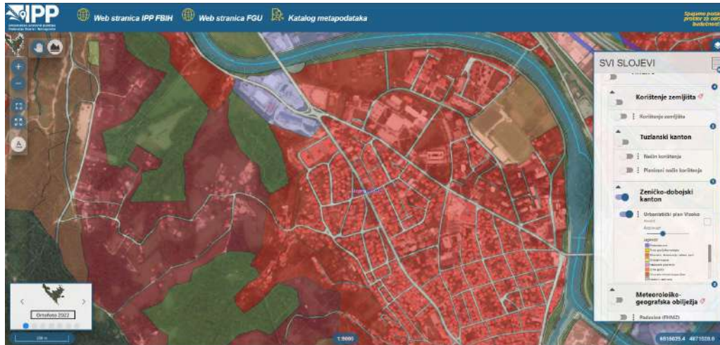
Slika 3: Preglednik Geoportala IPP FBiH

Na pregledniku Geoportala IPP FBiH su dostupna 94 sloja prostornih podataka koji pripadaju 19 INSPIRE tema.