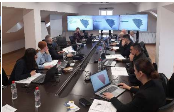
Slike 4.4, 4.5, 4.6: Izgradnja kapaciteta subjekata IPP

Na kraju svake održane edukacije obavljena je evaluacija stečenog znanja, u okviru kojeg su prisutni mogli iznijeti svoja zapažanja tijekom edukacije, uključujući sadržaj edukacije, metodiku i sve ostalo. Pregledom popunjenih obrazaca evaluacije provedenih edukacija, može se zaključiti da je edukacija uspješno provedena i da se ispunio zadati cilj.