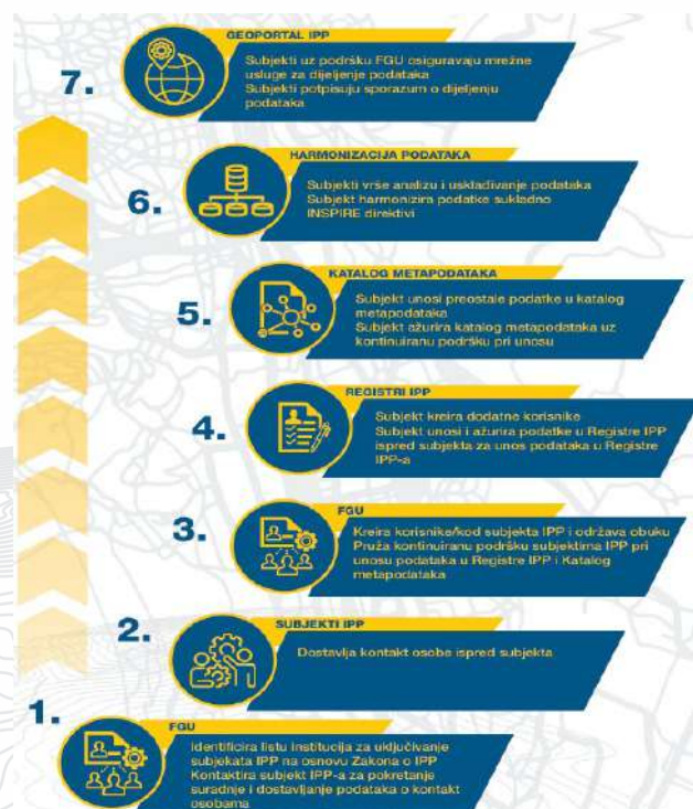
Slika 4.1: Organizacijski model uključivanja subjekata u IPP FBiH

Na temelju organizacijskog modela definirane su i razine spremnosti institucija koje su u tijeku realizacije aktivnosti redefinirane: